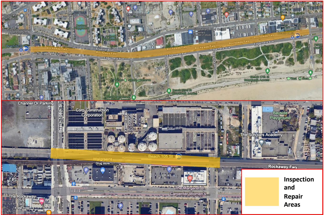
Map showing the areas where repair activities will be taking place. There may be temporary traffic disruptions along this area.