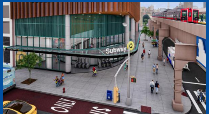
Representaciones de la estación de la calle 125 del Metro de la Segunda Avenida

¡Visite el Centro de Información Comunitario del Metro de la 2da Avenida!