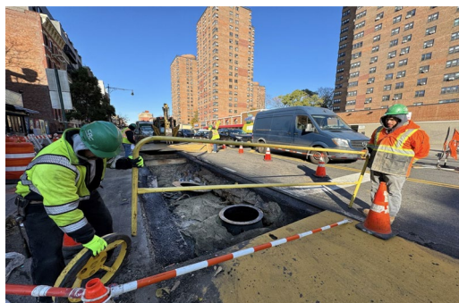
Excavación en la calle 106