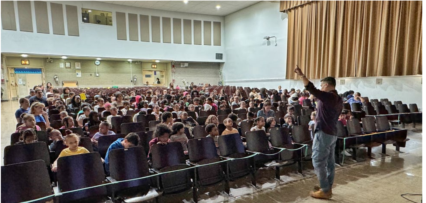
Programa de SASP2 dirigido a los estudiantes de la Escuela Primaria River East

Programa de Embajadores Estudiantiles: Anunciamos que la Academia Preparatoria Esperanza, ubicada en el Complejo Educativo Tito Puentes en la calle 109, se ha unido al Programa de Embajadores Estudiantiles del Metro de la Segunda Avenida. El programa trabaja con las escuelas locales para llevar la ciencia, la tecnología, la ingeniería, el arte y las matemáticas (STEAM) de la construcción del metro de la Segunda Avenida directamente a la sala de clases.