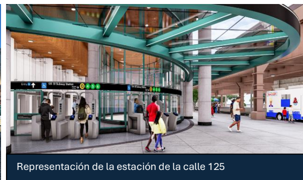
Representación de la estación de la calle 125