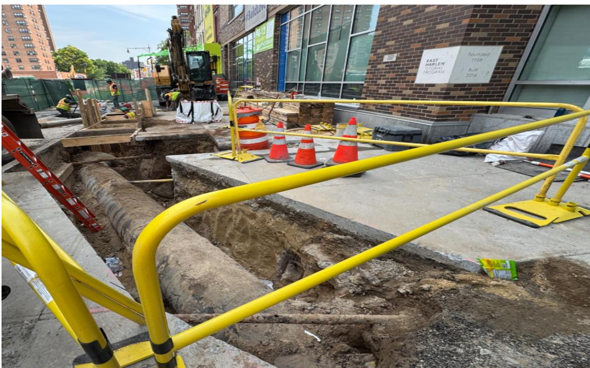
Excavación en la calle 105 y la Segunda Avenida

Se construye una nueva bóveda de servicios eléctricos en la calle 110 entre la 2ª y la 3ª avenida El trabajo de reubicación de servicios públicos de la Fase 2 continúa en el lado oeste de la Segunda Avenida entre las calles 106 y 110. La obra del lado oeste trasladará los servicios subterráneos de gas, agua y electricidad fuera de debajo de la avenida y las calles laterales para dar paso al túnel y las vías de la nueva estación de la calle 106.